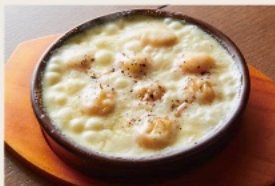
Gnocchi with raclette cheese sauce きたあかりのニョッキ - ラクレットチーズソース -