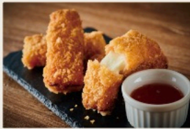
Mozzarella cheese & Jamon serrano frit モッツァレラチーズの 生ハムフリット