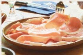
Spanish Jamon serrano 【スペイン産】18ヶ月熟成 ハモンセラノ