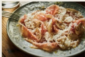
Spanish Jamon serrano, with mushroom & Parmesan 【スペイン産】18ヶ月熟成 ハモンセラノと たっぷりマッシュルーム、 パルミジャーノがけ