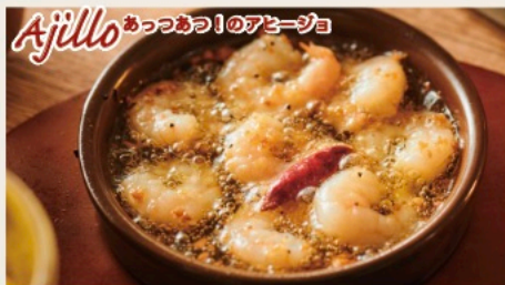
Ajillo あっっっっ！のアヒージョ Shrimp sherry flavored Ajillo 海老のシェリー酒風味のアヒージョ