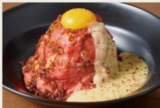
Roast beef bowl with raclette cheese sauce やわらかしっとり ローストビーフ丼 -ラクレットチーズソース-(シングル)