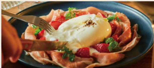
【Italy】Burrata cheese, Seasonal fruits & Jamon serrano 【イタリア産】 Burrataチーズと季節のフルーツ 【スペイン産】18ヶ月熟成ハモンセラノのせ