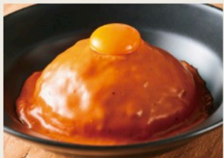
Tomato & cheese keema curry 長寿卵 on! チーズ屋さんの ”特製トマト&チーズ キーマカレー”