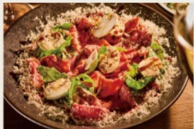
Roast beef carpaccio, with mushroom & arugula 自家製！ローストビーフ - カルパッチョ仕立て - たっぷりマッシュルームと ルッコラのせ