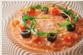
Salmon carpaccio サーモンカルパッチョ