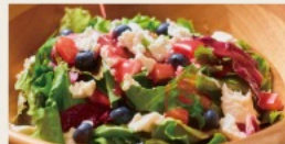
Ricotta cheese berry salad -Raspberry dressing- リコッタチーズのベリーサラダ -ラズベリードレッシング-