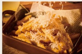
Crisp! French fries トリュフ香るカリッと！ フライドポテト