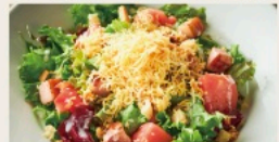
Caesar Salad Thick-cut bacon & Smoked cheddar cheese 厚切りベーコンと スモークチェダーチーズの シーザーサラダ