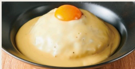
Cheese shop made original cheese keema curry 長寿卵 on! チーズ屋さんの ”特製キーマカレー”-ラクレットチーズソース-