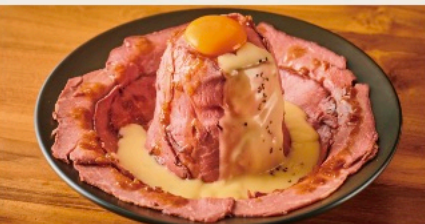
Roast beef bowl with raclette cheese sauce やわらかしっとり ローストビーフ丼-ラクレットチーズソース- 肉のじゅうたん ver. (ダブル)