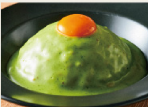
Basil & cheese keema curry 長寿卵 on! チーズ屋さんの ”特製パジル&チーズ キーマカレー”