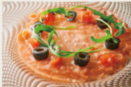
Salmon carpaccio サーモンカルパッチョ