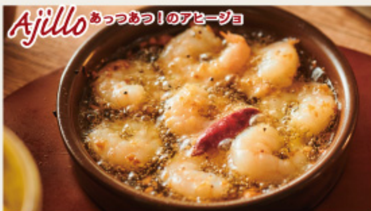
Shrimp sherry flavored Ajillo 海老のシェリー酒風味のアヒージョ