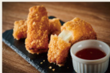
Mozzarella cheese & jamon serrano frit モッツァレラチーズの 生ハムフリット