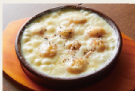
Gnocchi with raclette cheese sauce きたあかりのニョッキ -ラクレットチーズソース-