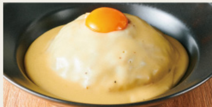
Cheese shop made original cheese keema curry 長寿卵 on! チーズ屋さんの ”特製キーマカレー” -ラクレットチーズソース-