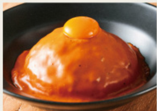
Tomato & cheese keema curry 長寿卵 on! チーズ屋さんの ”特製トマト&チーズ キーマカレー”