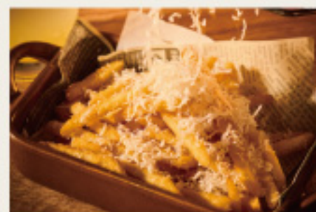
Crisp! French fries トリュフ香るカリッと！ フライドポテト