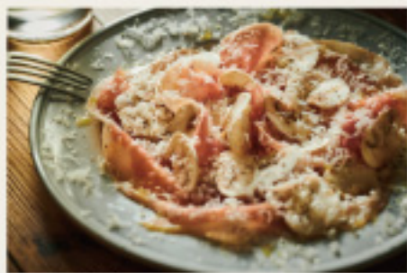
Spanish jamon serrano, with mushroom & Parmesan 【スペイン産】18ヶ月熟成 ハモンセラノーと たっぷりマッシュルーム、 パルミジャーノがけ