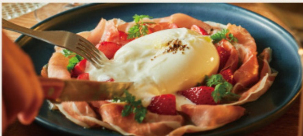
【Italy】 Burrata cheese, Seasonal fruits & jamon serrano 【イタリア産】 プッラータチーズと季節のフルーツ 【スペイン産】 18ヶ月熟成ハモンセラノーのせ