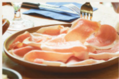
Spanish jamon serrano 【スペイン産】18ヶ月熟成 ハモンセラノー