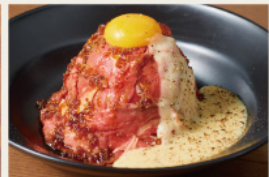
Roast beef bowl with raclette cheese sauce やわらかしっとり ローストビーフ丼 -ラクレットチーズソース-(シングル)