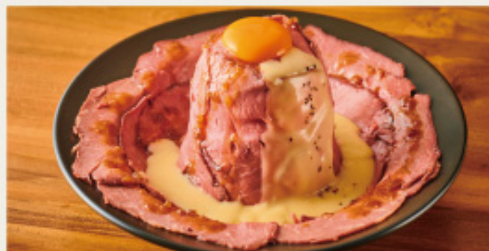
Roast beef bowl with raclette cheese sauce やわらかしっとり ローストビーフ丼 -ラクレットチーズソース- 肉のじゅうたん ver. (ダブル)