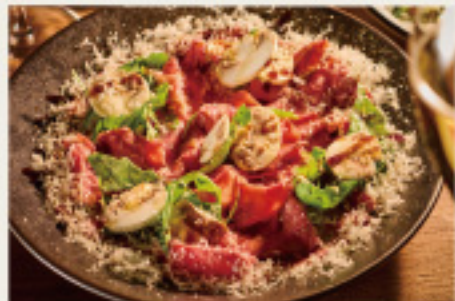
Roast beef carpaccio, with mushroom & arugula 自家製！ローストビーフ -カルパッチョ仕立て- たっぷりマッシュルームと ルッコラのせ