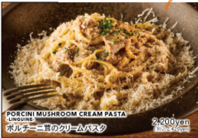
PORCINI MUSHROOM CREAM PASTA -LINGUINE- ポルチーニ茸のクリームパスタ