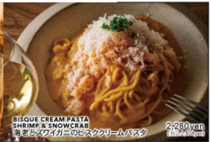
BISQUE CREAM PASTA SHRIMP & SNOWCRAB 海老とズワイガニのビスケクリームパスタ