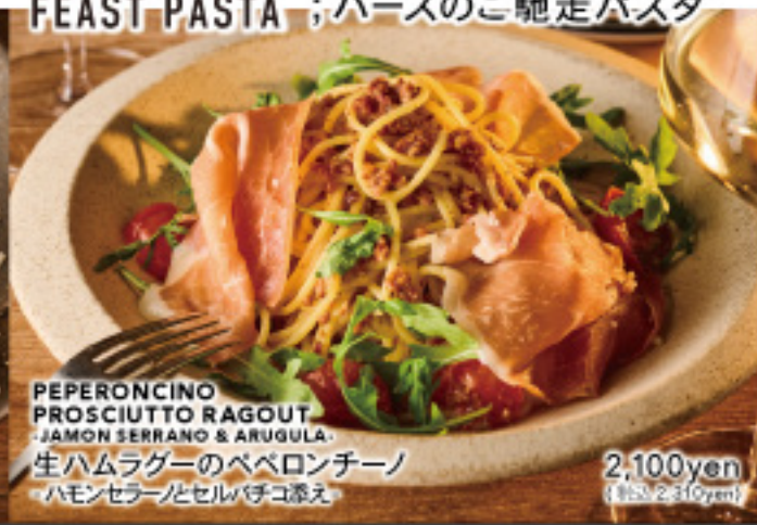
PEPERONCINO PROSCIUTTO RAGOUT -JAMON SERRANO & ARUGULA- 生ハムラガーのペペロンチーノ -ハモンセラノとセルバチコ添え-