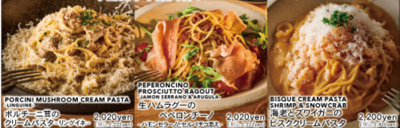
PORCINI MUSHROOM CREAM PASTA (Linguine) 2,020yen (税込2,222yen) ポルチーニ茸のクリームパスタ-リングイネ- PEPERONCINO PROSCIUTTO RAGOUT (Jamon serrano & Arugula) 2,020yen (税込2,222yen) 生ハムラグーのペペロンチーノ BISQUE CREAM PASTA SHRIMP & SNOWCRAB 2,200yen (税込2,420yen) 海老とズワイガニのビスククリームパスタ