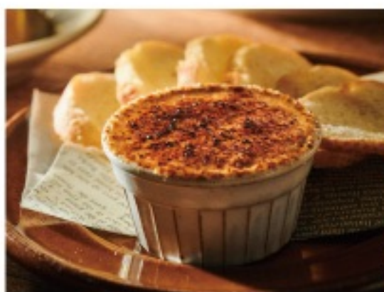
DRIED FRUIT HONEY CHEESE