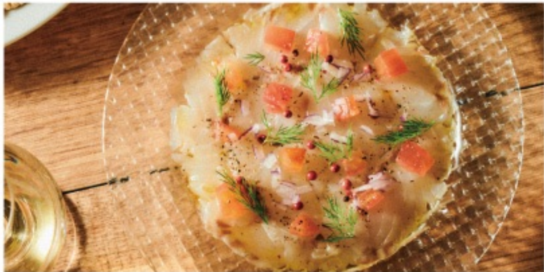
SEASONAL CARPACCIO 季節の鮮魚と食材のカルパッチョ