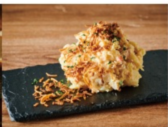
CREAM CHEESE & IBURI GAKKO SMOKY POTATO SALAD