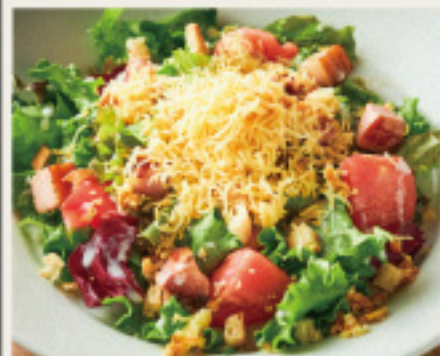
Avocado and Arugula Salad アボカドとルッコラのサラダ ~バルサミコドレッシング~ 880円 (税込968円)