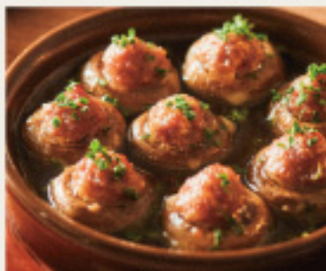
Prosciutto and Mushrooms Ajillo 生ハムとマッシュルームの おつまみアヒージョ 880円 (税込968円)