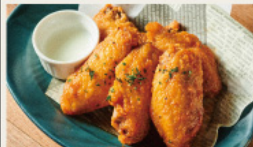
Addictive! Buffalo Chicken やみつき! パッファローチキン 5ピース 750円 (税込825円)