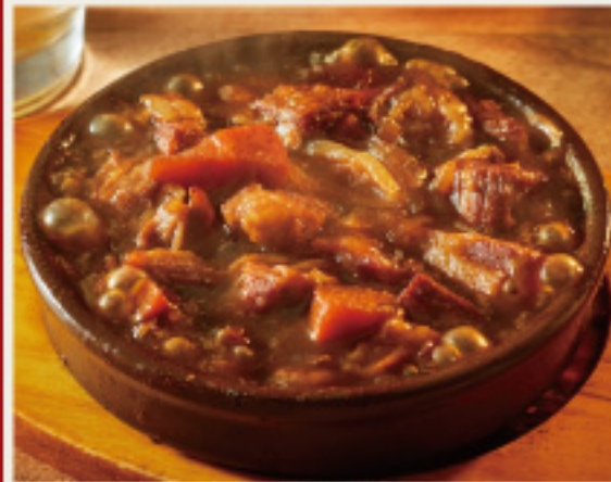
Japanese Black stewed in beer 黒毛和牛スジのビール煮込み 黒ビールと香味野菜で煮込んだ牛スジは、 コクがあり、とろとろの仕上がり。 熱々でお召し上がり下さい！ 780円 (税込858円)