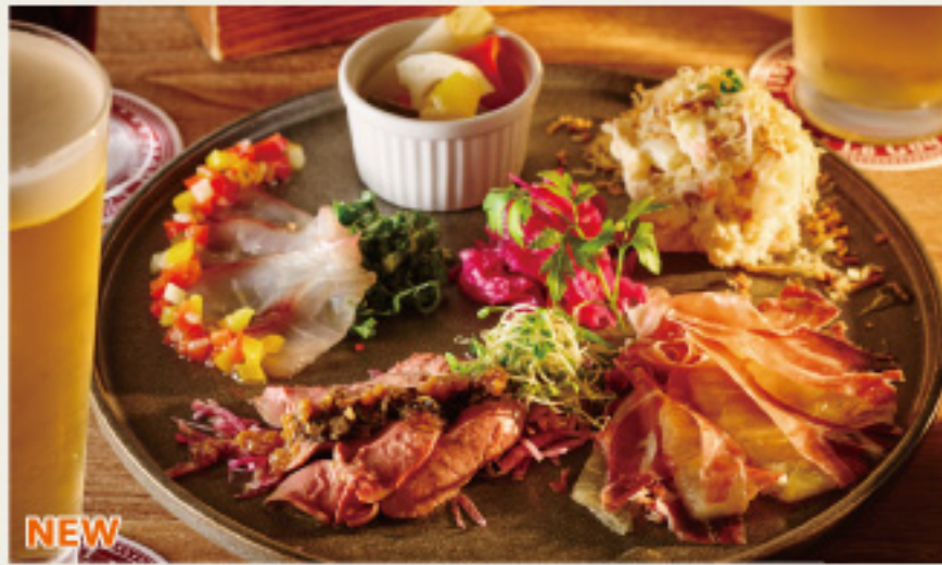
NEW Today's Appetizer Assorted 本日の前菜5種盛り合わせ 1680円 (税込1848円)