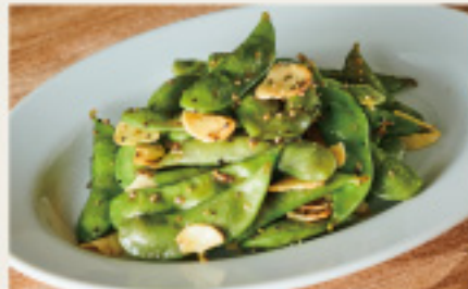
Garlic Edamame ガーリック枝豆 530円 (税込583円)