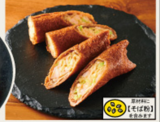
Shrimp Spring Roll ぷりぷり海老のカリッと春巻き 650円 (税込715円)