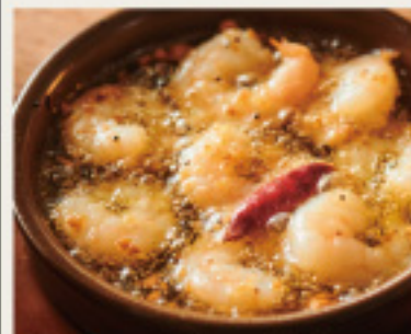
Shrimp with Sherry Ajillo 海老のシェリー酒風味の アヒージョ 780円 (税込858円)