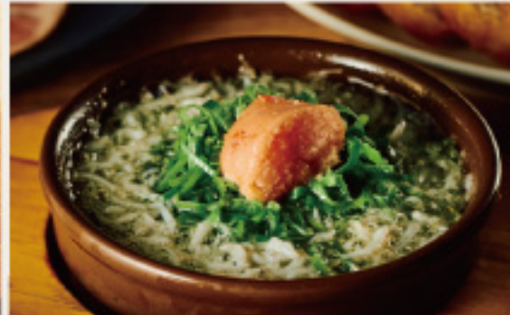
Shirasu, Kujo negi & Raw mentaiko Ajillo 釜揚げしらす、九条ネギと 生明太子のアヒージョ 850円 (税込935円)