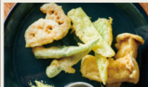
Crispy fritters of seasonal vegetables 季節野菜のサクサクフリット 850円 (税込935円)