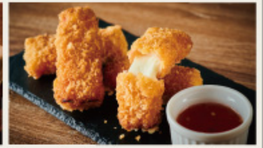
Mozzarella cheese jamon serrano Frito モッツァレラチーズの 生ハムフリット 880円 (税込968円)