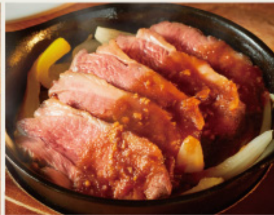
Lamb Steak - Onion Garlic Sauce- ラム肉ステーキ - オニオンガーリックソース- 柔らかく焼きあげたラム肉を、 フルーティー且つパンチのあるソースで。 980円 (税込1078円)