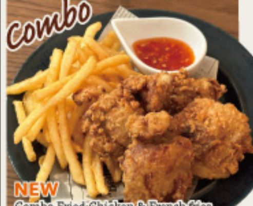
NEW Combo Fried (Chicken & French fries) フライドチキン&ポテトコンボ 1100円 (税込1210円)