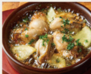
Oysters from [Hiroshima] Lemon Ajillo 【広島産】牡蠣のレモン アヒージョ 880円 (税込968円)