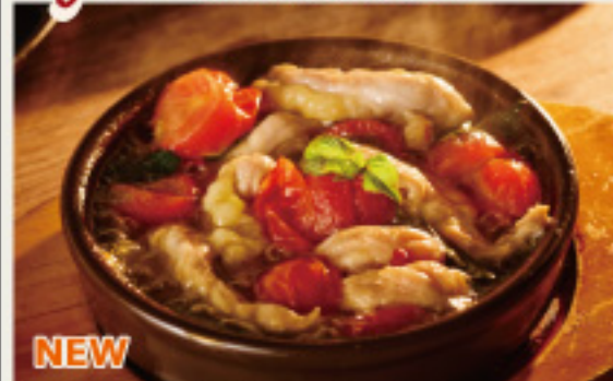
NEW Chicken neck & Homemade dried tomato 鶏セセリと自家製セミドライトマトの アヒージョ 850円 (税込935円)