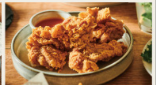
Fried Chicken - sweet chili sauce- フライドチキン - スイートチリソース - 730円 (税込803円)