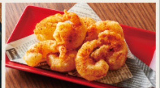
Shrimp spicy frit 海老のスパイシーフリット 750円 (税込825円)