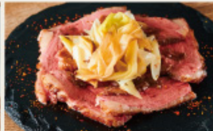
"KAMOpaccio" Duck and Grilled Green Onion 鴨と焼きねぎの カモパッチョ 730円 (税込803円)