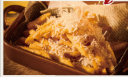
Crisp! French fries - truffle flavor & parmigiano- トリュフ香るカリッと! フライドポテト 800円 - ふんわりバルミジャーノがけ - (税込880円)